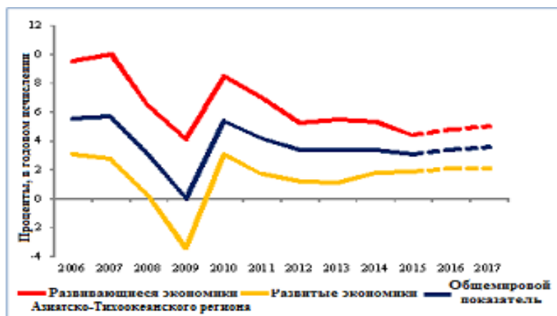
Диаграмма I Рост развивающихся экономик Азиатско-Тихоокеанского региона и ведущих развитых экономик мира, 2006-2017 годы

Источник: Прогнозы ЭСКАТО и база данных Международного валютного фонда «World Economic Outlook». База данных доступна по ссылке: www.imf.org/external/data.htm .