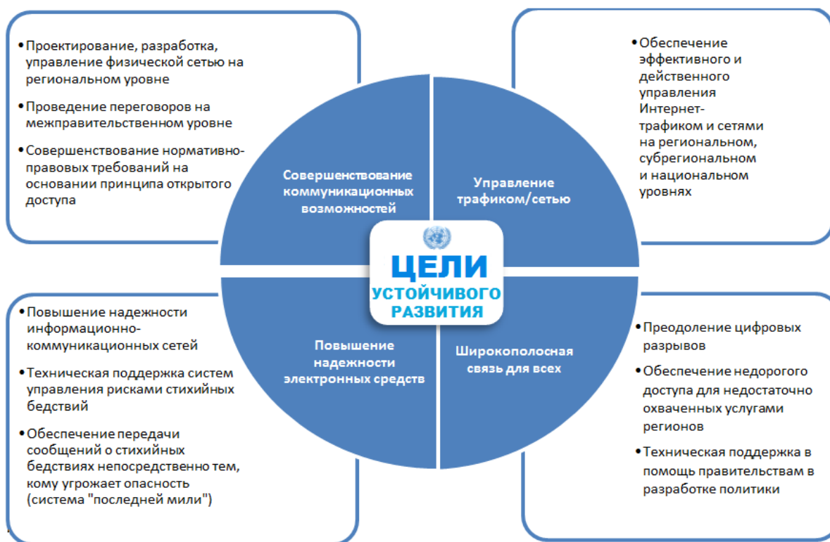
Диаграмма I Четыре ключевых элемента Азиатско-тихоокеанской информационной супермагистрали

23. ЭСКАТО и Международный союз электросвязи совместно разработали интерактивную карту информационной супермагистрали 10 . Интерактивная карта используется для выявления недостающих наземных оптоволоконных соединений, а также «узких мест» глубоководных кабельных сетей.