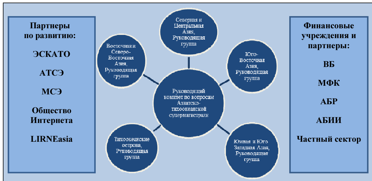
Диаграмма IV Региональные партнеры

Сокращения: АБР – Азиатский банк развития, АБИИ – Азиатский банк инвестиций в инфраструктуру; АТСЭ – Азиатско-тихоокеанское сообщество по электросвязи; ЭСКАТО – Экономическая и социальная комиссия для Азии и Тихого океана; МФК – Международная финансовая корпорация; ОИ, Общество Интернета; МСЭ – Международный союз электросвязи; ВБ – Всемирный банк.